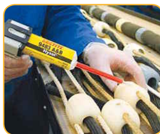
Loctite® Hysol® 9483 A&B

Loctite® Hysol® 3423 A&B je univerzálne 2-zložkové epoxidové lepidlo vhodné pre vyplňanie špár a vertikálne nanášanie. Ideálne pre lepenie kovových komponentov