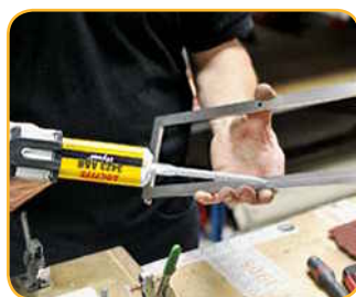
Loctite® Hysol® 3423 A&B