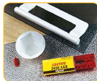
Loctite® Hysol® 3430 A&B

Loctite® Hysol® 9483 A&B je univerzálne 2-zložkové epoxidové lepidlo vhodné na lepenie a zalievanie všade tam, kde sa vyžaduje optická čistota a vysoká pevnosť. Ideálne na lepenie dekoratívnych panelov a displejov