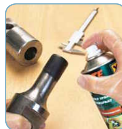
Loctite® 8154 aerosól