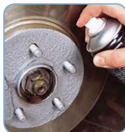
Plechovka Loctite® 8150 Loctite® 8151 aerosól