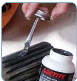
Loctite® 8012 nádobka so štetcom